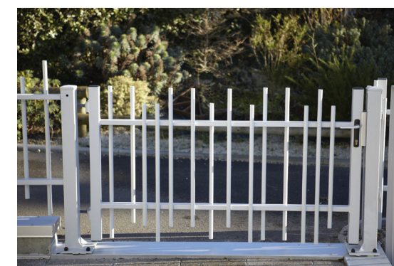
PORTILLON ELANCE® PAGE 82