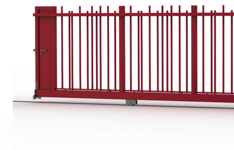
PORTAIL AUTOPORTANT / COULISSANT PAGE 88 ET 90