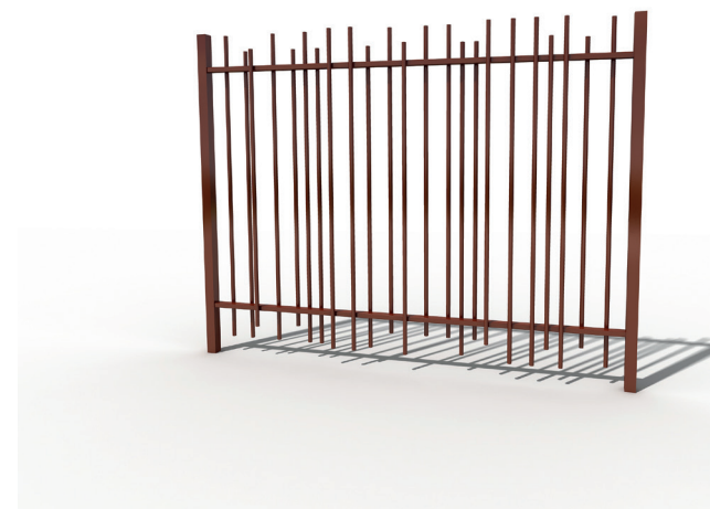
GRILLE ELANCE® DESIGN