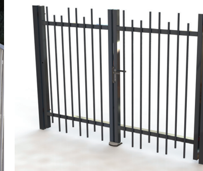
PORTAIL ELANCE® PAGE 84