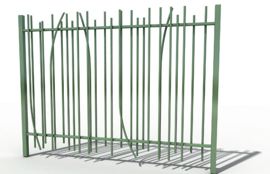
GRILLE ELANCE® NATURE